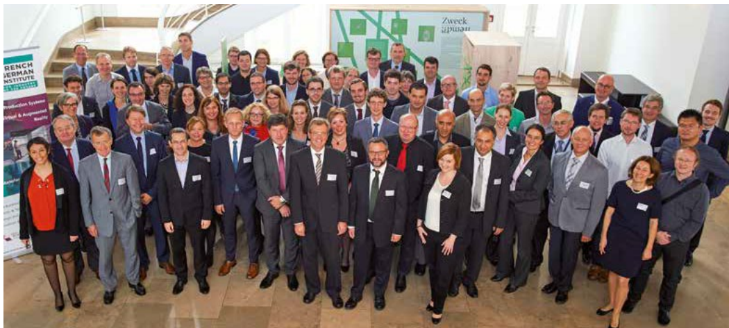
Inauguration du French-German Institute for Industry of the Future à Karlsruhe le 06 Octobre 2017

Afin de bien préciser le contexte et les enjeux liés à ce collège doctoral, nous avons analysé les challenges de l'Industrie du Futur ou Industrie 4.0. Appelées Industrie 4.0 en Allemagne, Smart Manufacturing aux Etats-Unis, Industrie du Futur en France ou Made in China 2025 en Chine, toutes ces initiatives s'appuient très fortement sur les Technologies de l'Information et de la Communication (TIC), mais elles se distinguent sur plusieurs points.