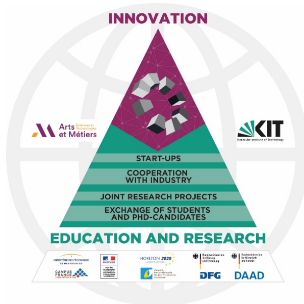
Structure du French-German Institute for Industry of the Future